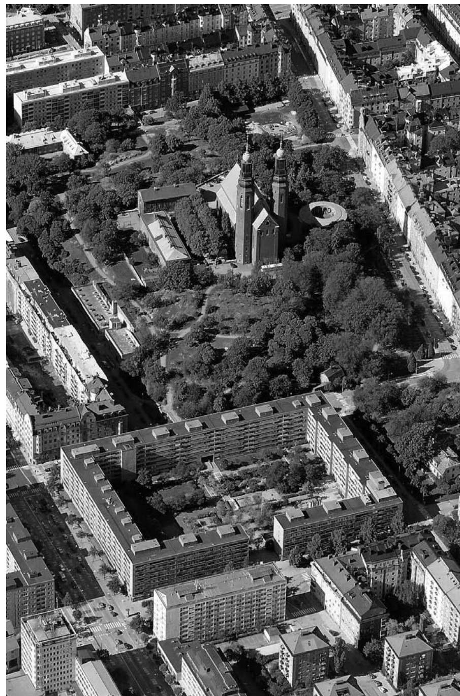
Kvarteret Plankan, Södermalm, Stockholm.